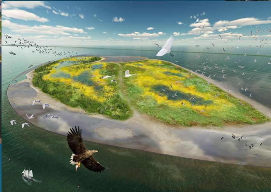
Bouwen met de Natuur