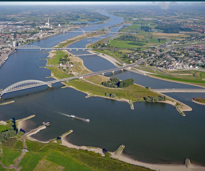
Ruimte voor de Rivier