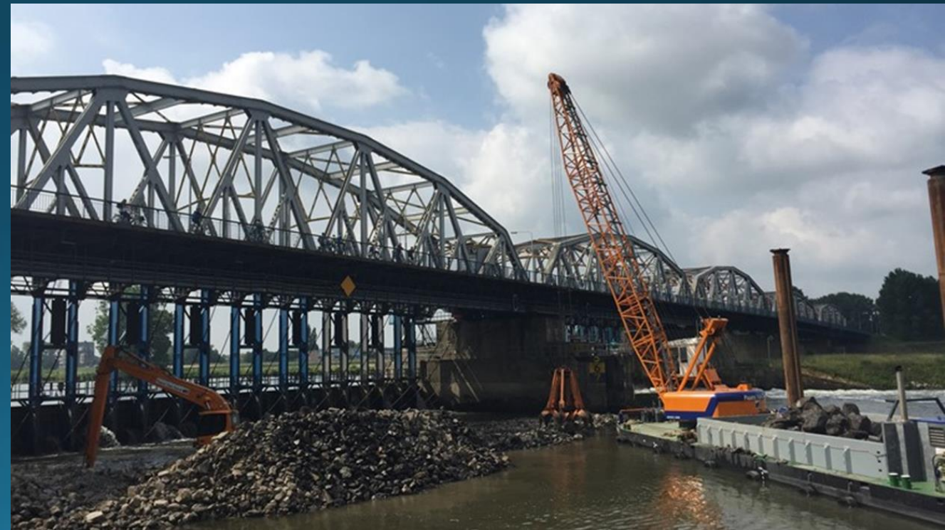
Vervanging en renovatie infrastructuur